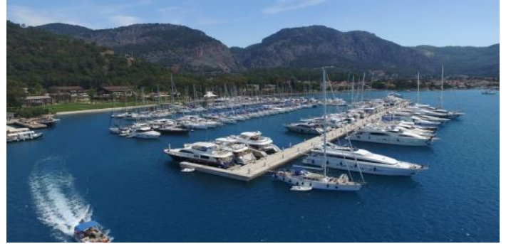
VILLAGE PORT GÖCEK