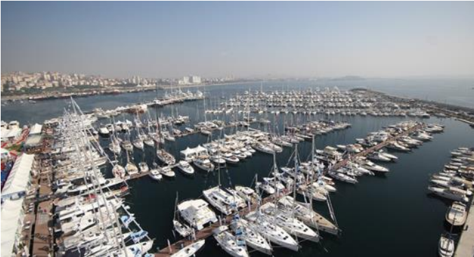
İSTANBUL CITY PORT